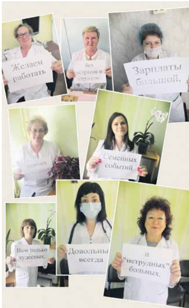
Поликлиника г. Копейска