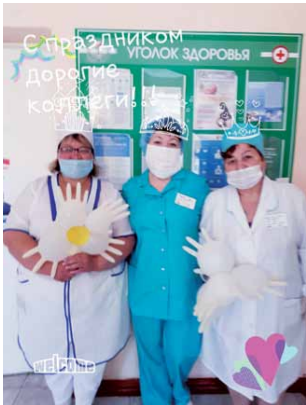
Приемный покой СП Копейск