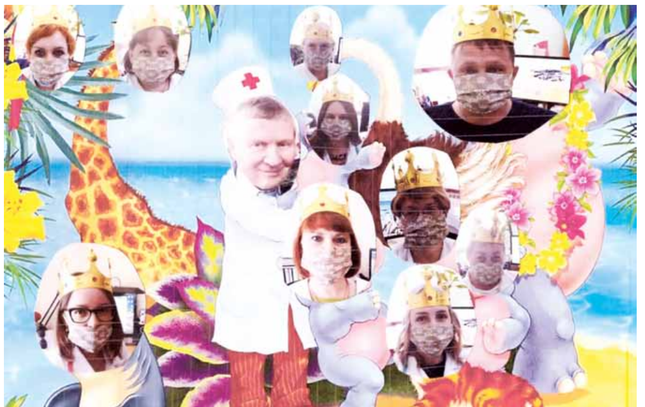
Администрация ГБУЗ «ОТБ № 1»

Чтобы вы желали и влюблялись, Чтобы вы дышали и могли, Чтобы все желания сбывались, Чтобы вас родные берегли.