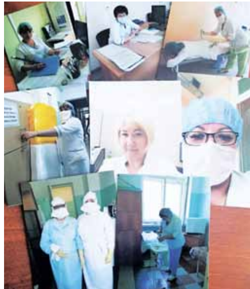
2 СФО СП Копейск

Пусть умножаются, конечно же, доходы И в семьях будет искренне тепло. Вам мирного желаем небосвода И на душе бывало чтоб светло.